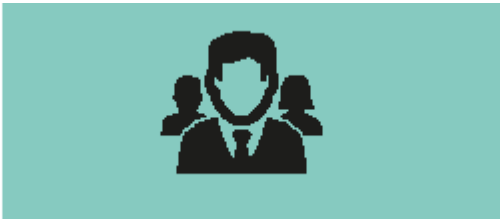
Cultuur en professionals